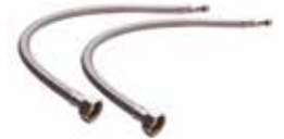
2 Mangueras de vinilo Monomando 18" M8 COD. SG0087920001BO

Aireador dirigible, herramienta para aireador